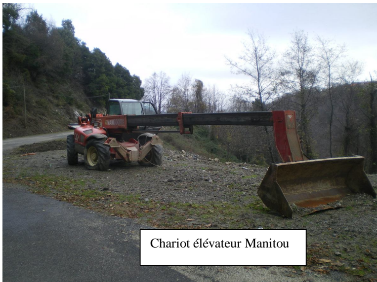
Chariot élévateur Manitou

Renseignements au: 04.95.55.00.80 (le matin) ou 04.95.37.05.97