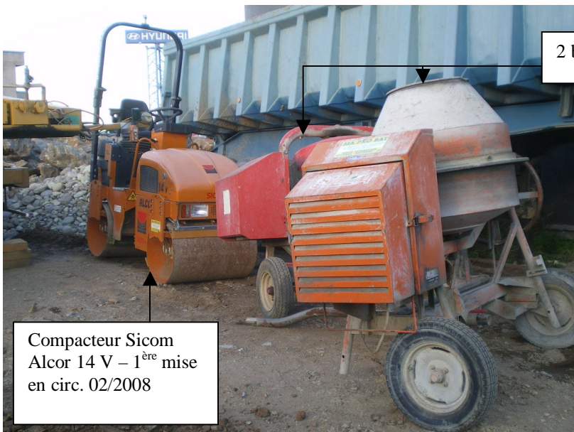
Compacteur Sicom Alcor 14 V – 1 ère mise en circ. 02/2008