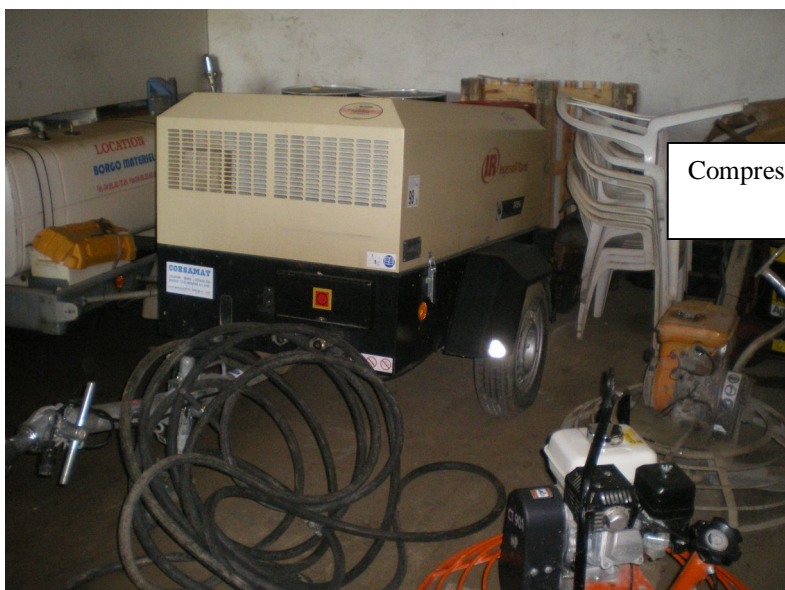
Compresseur Ingersoll 06/2007