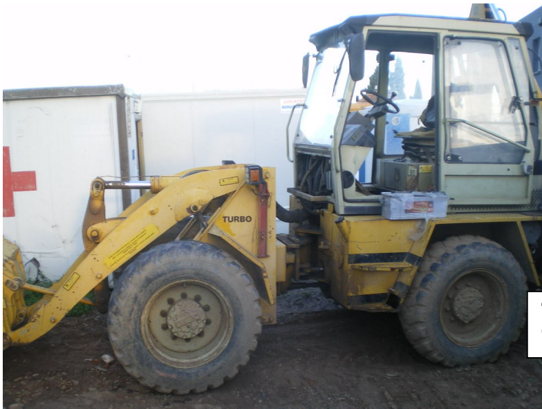
Tracto pelle Benfra E1 45 B – Godet enfoncé