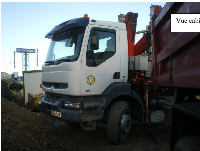
Vue cabine Renault Kerax