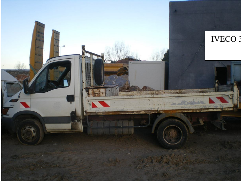
IVECO 35 J 13 – 1 ère mise en circ. 07/2004