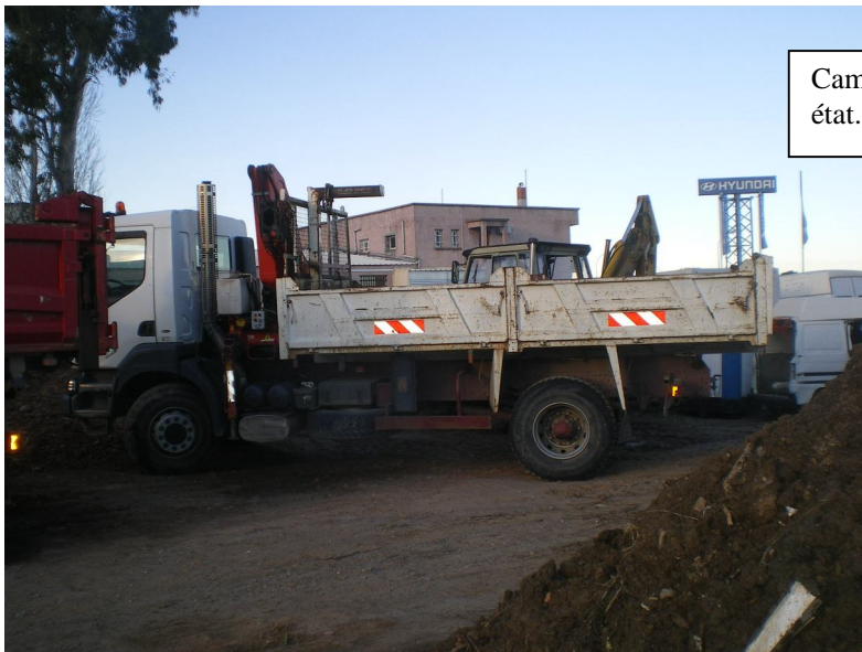
Camion Renault Kerax avec grue en bon état. Année 1998, Kms 194250