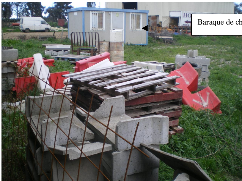
Baraque de chantier