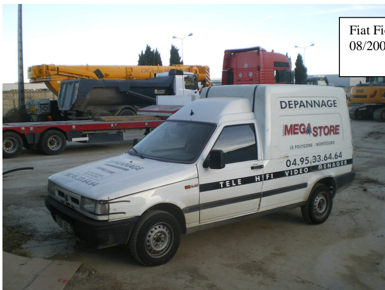
Fiat Fiorino, 1 ère mise en circ. 08/2000 – Kms 132000