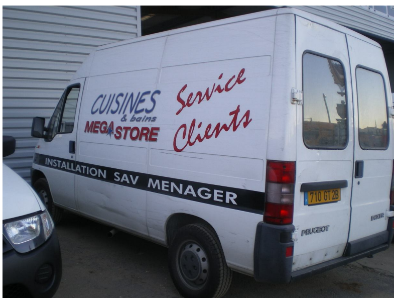
Peugeot Boxer – 1 ère mise en circ. 10/2000 – Kms 80.000