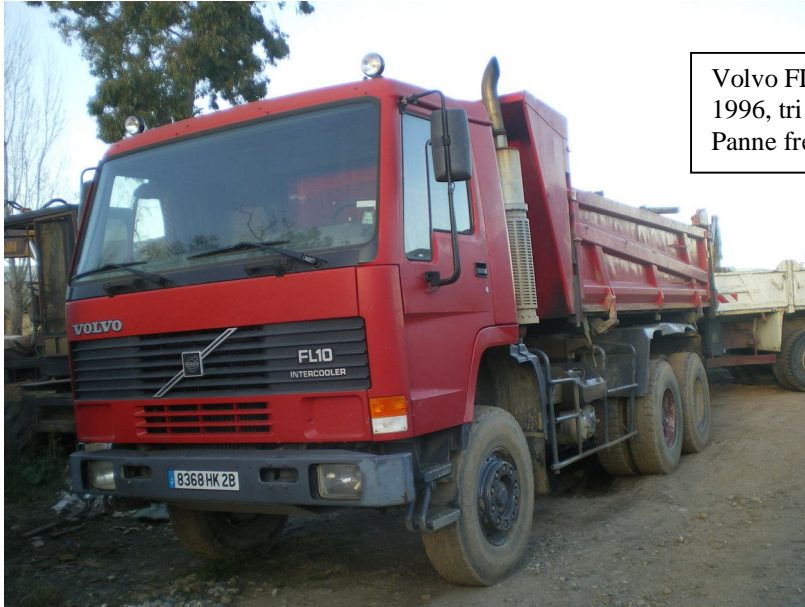
Volvo FL 10, 1 ère mise en circ. 1996, tri benne – Batteries HS – Panne freins