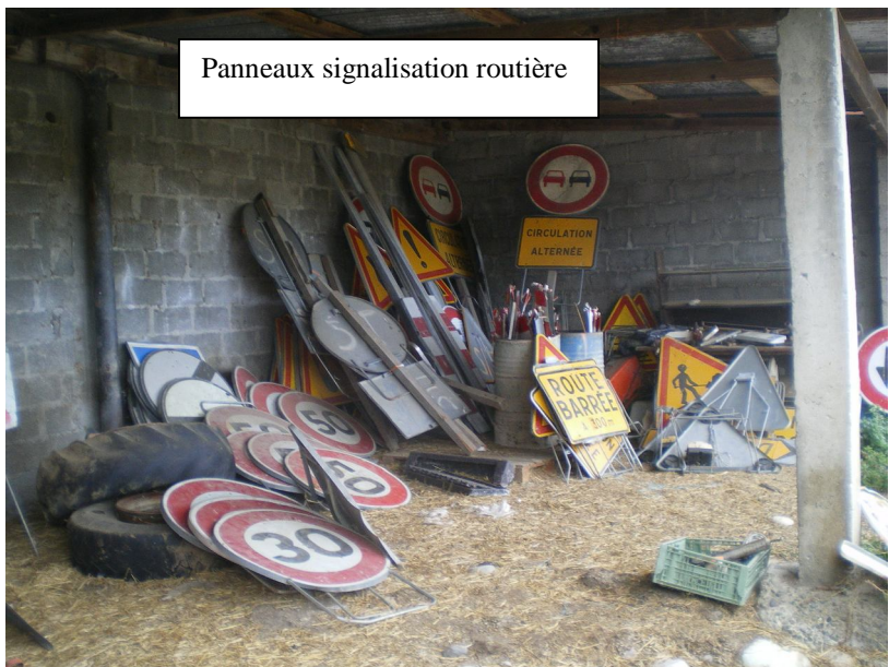
Panneaux signalisation routière

IMPORTANT Engins et matériels vendus en l'état, sans garantie de fonctionnement, de quantité, de qualité, de kilométrage, etc ... Les informations données sur l'état ne sont pas limitatives